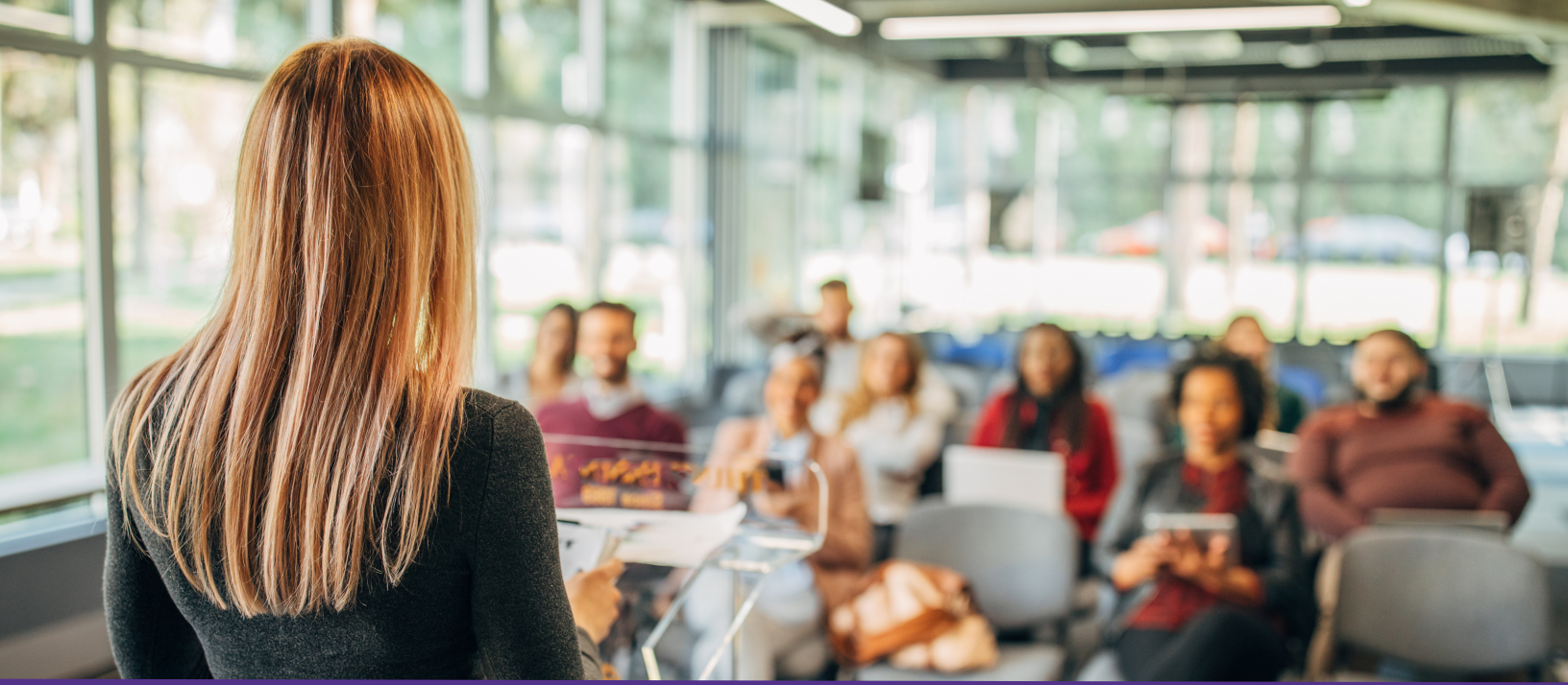
Tabla de contenidos